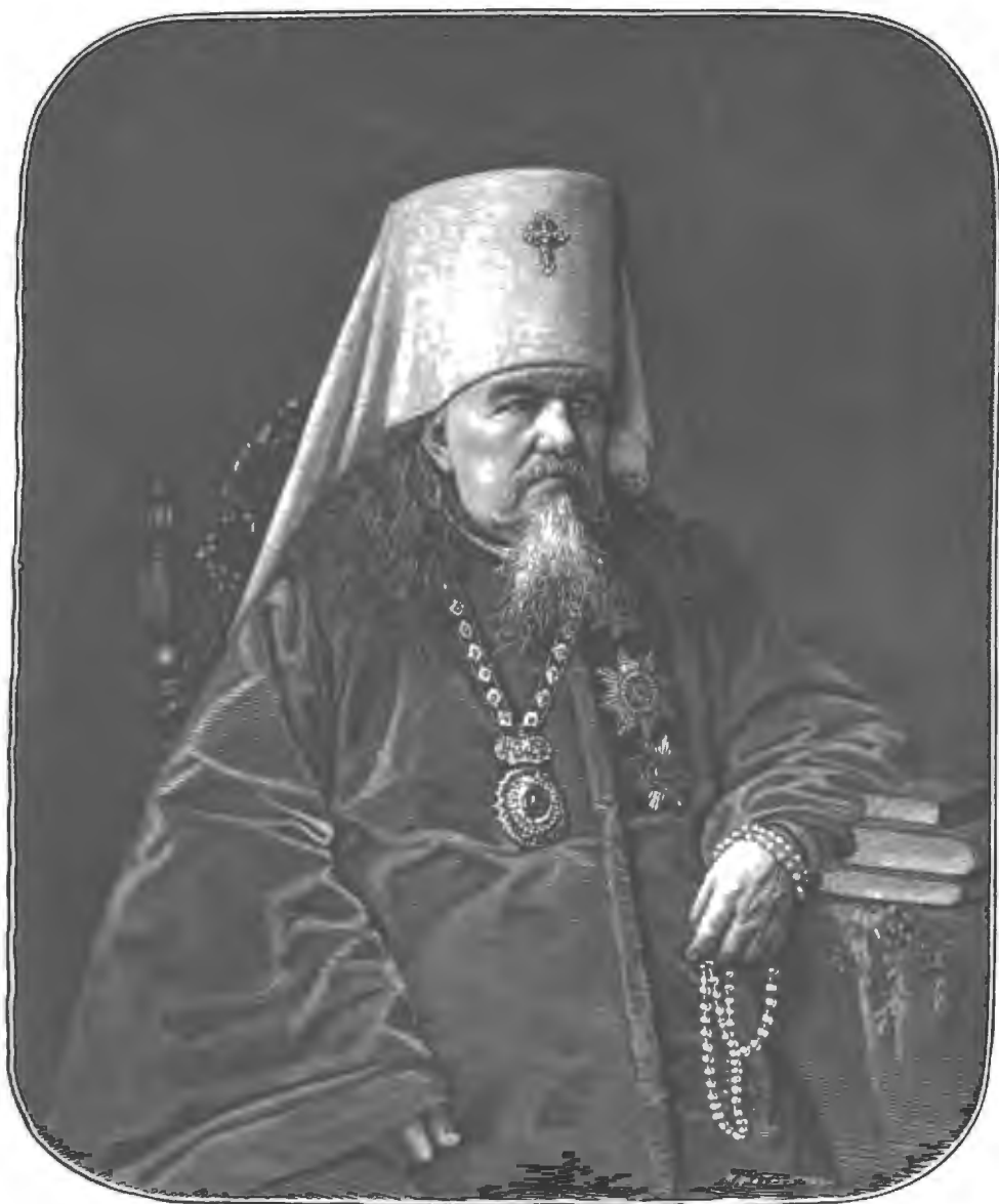
ВЫСОКОПРЕОСВЯЩЕННЫЙ МИТРОПОЛИТЪ НОВГОРОДСКІЙ, С.-ПЕТЕРБУРГСКІЙ И ФИНЛЯДСКІЙ ИСИДОРЪ.